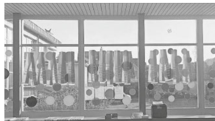
Der Zwischentrakt wurde zum Wettkampfbüro am Pfingstrennen

Meldet euch gerne noch an, 21 Tage radeln für mehr Radförderung, Klimaschutz und Lebensqualität.