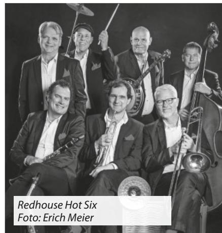
Redhouse Hot Six

Am Sonntag, den 12.7. schließt die Ausstellung um 18 Uhr, und damit enden die 36. Merdinger Kulturtage.