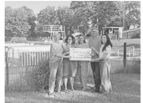
Spendenübergabe der SPD Offenen Liste Merdingen an den Förderverein Kaiserstuhlbad e.V.

Wir hoffen, dass das Kaiserstuhlbad den Bürgern auch künftig erhalten bleibt. Gleichzeitig möchten wir alle, denen das Bad am Herzen liegt, ermutigen, die Bemühungen des Fördervereins ebenfalls zu unterstützen. Jeder Beitrag hilft, dieses wertvolle Angebot für die Zukunft zu sichern.