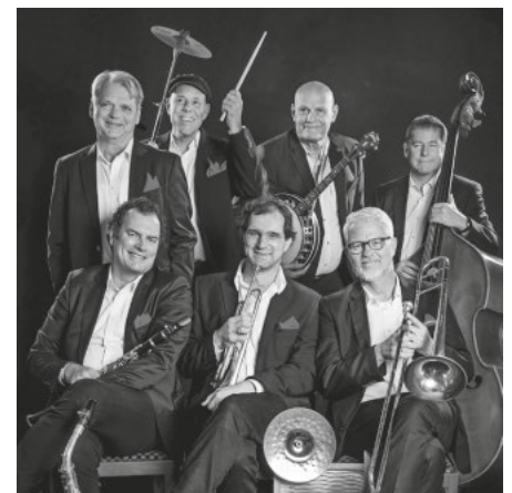
Redhouse Hot Six