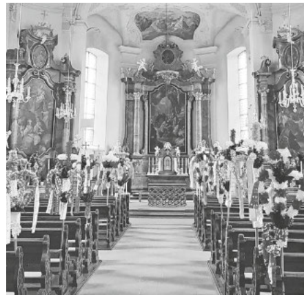
Palmsonntag in Merdingen