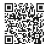
QR-Code Meine Umwelt App

Sichtungen von Einzeltieren und insbesondere Nester sollen weiterhin ausschließlich über die Meldeplattform der Landesanstalt für Umwelt gemeldet werden. Dies kann über die Homepage der Landesanstalt für Umwelt (LUBW) oder über die kostenlose „Meine Umwelt-App“ erfolgen: